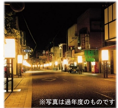
※写真は過年度のもので 夜間運行時の走行環境イメージ