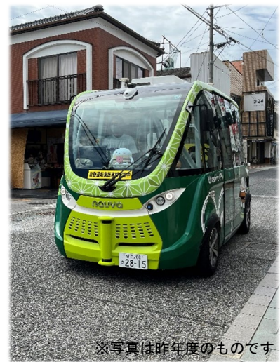
※写真は昨年度のもので 自動運転EVバス運行の様子

https://www.city.ureshino.lg.jp/shisei/keikaku/_28638/_30135.html